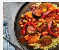
Tajine de 5 verduras