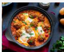
Tajine de kefta