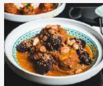
Tajine de cordero con ciruelas