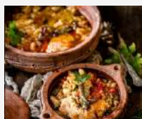
Tajine de pescado