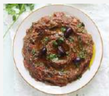
Zaalouk de berenjena