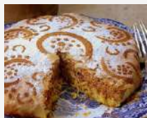
Pastilla de poulet