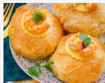
Pastilla de poisson