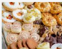
Assortiment de gâteau