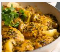
Tajine de poulet